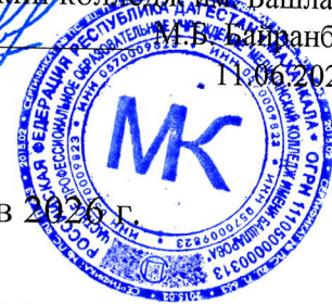
График проведения первичной аккредитации в 2026 г.